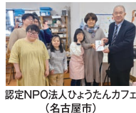
認定NPO法人ひょうたんカフェ (名古屋市)