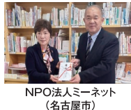
NPO法人ミーネット (名古屋市)