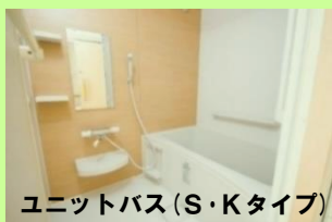
ユニットバス(S・Kタイプ)