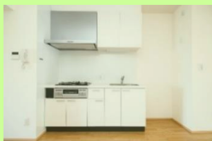
3口コンロ完備のキッチン