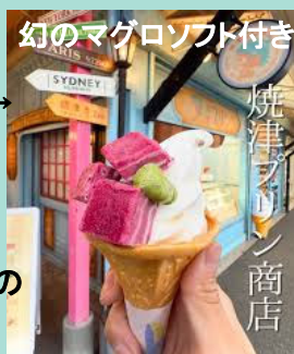
幻のマグロソフト付き

B・I・Yとは… 16種類の茶葉の中から自分好みの green teaが作れる体験です！