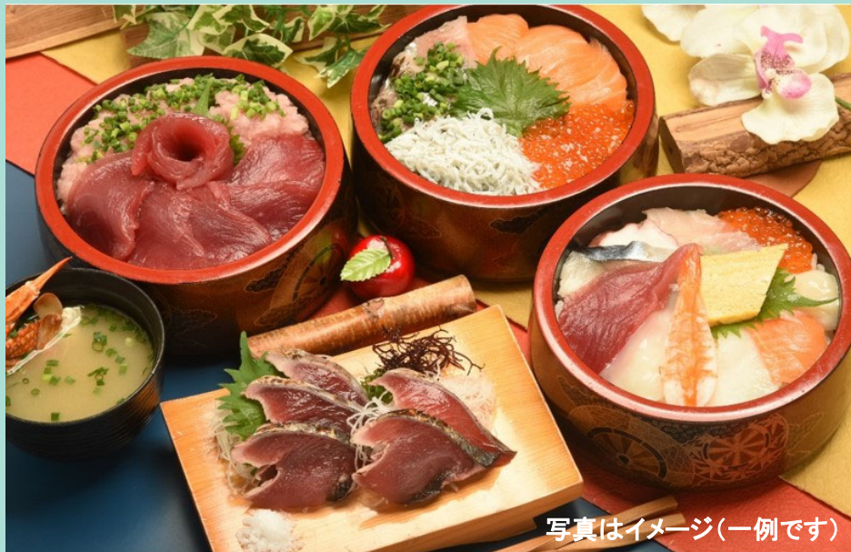
写真はイメージ(一例です)

鮪赤身・海老・釜揚げしらす いくら・サーモン・帆立・アジ メさば・つぶ貝・いか・たこ 真鯛・白身魚・ねぎとろ 玉子焼き