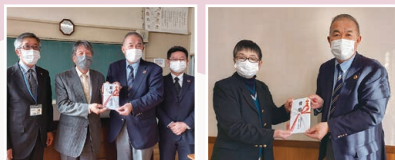
NPO法人てほへ(東栄町) NPO法人フロンティアとよはし 2021年度分贈呈式(2022.1/21)

2021年度は 600,000円の 寄附をいたしました。 皆様のお気持ち、 ありがとうございました。