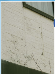
補修が必要となる外壁の例▲

「最近、外壁が変色して壁の塗料が浮いていたり、カビ臭く、湿っぽいので雨漏りしていないか心配。台風のシーズンも迫ってきているので雨漏りを防ぐ為にも調査と外壁塗装をお願いしたい」というご依頼を受けました。